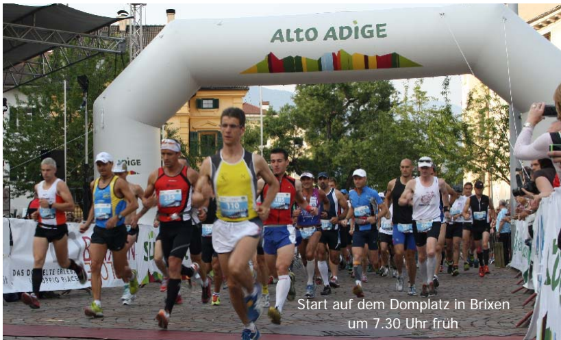
Start auf dem Domplatz in Brixen um 7.30 Uhr früh

Gründe nach Südtirol zu kommen gibt es viele. Kultur und Landschaft, aber auch die bekannte Gastfreundschaft sprechen bei kurzen Entfernungen aus Bayern und Süddeutschland für einen Aufenthalt. Die Partnerhotels des BRIXEN DOLOMITEN MARATHON stellen sich in vielen Belangen für einen ruhigen,